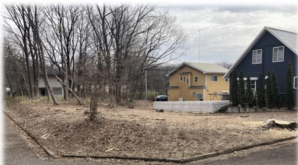
北西側より撮影現地土地 【掲載写真:2024年4月撮影 ※街並み含む】