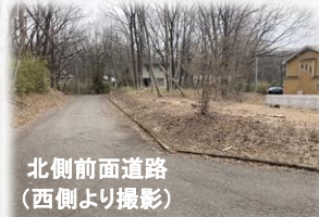
北側前面道路 (西側より撮影)