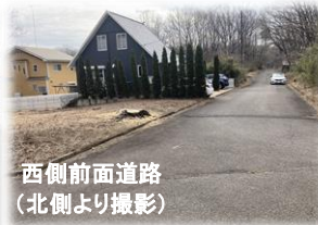
西側前面道路 (北側より撮影)